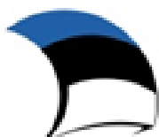
Eesti tuleviku heaks